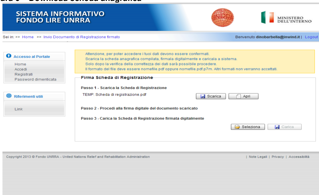
Figura 6 – Download scheda anagrafica