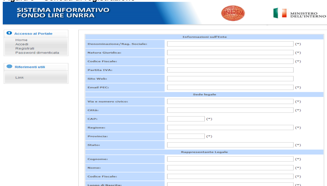
Figura 3 – Scheda di registrazione